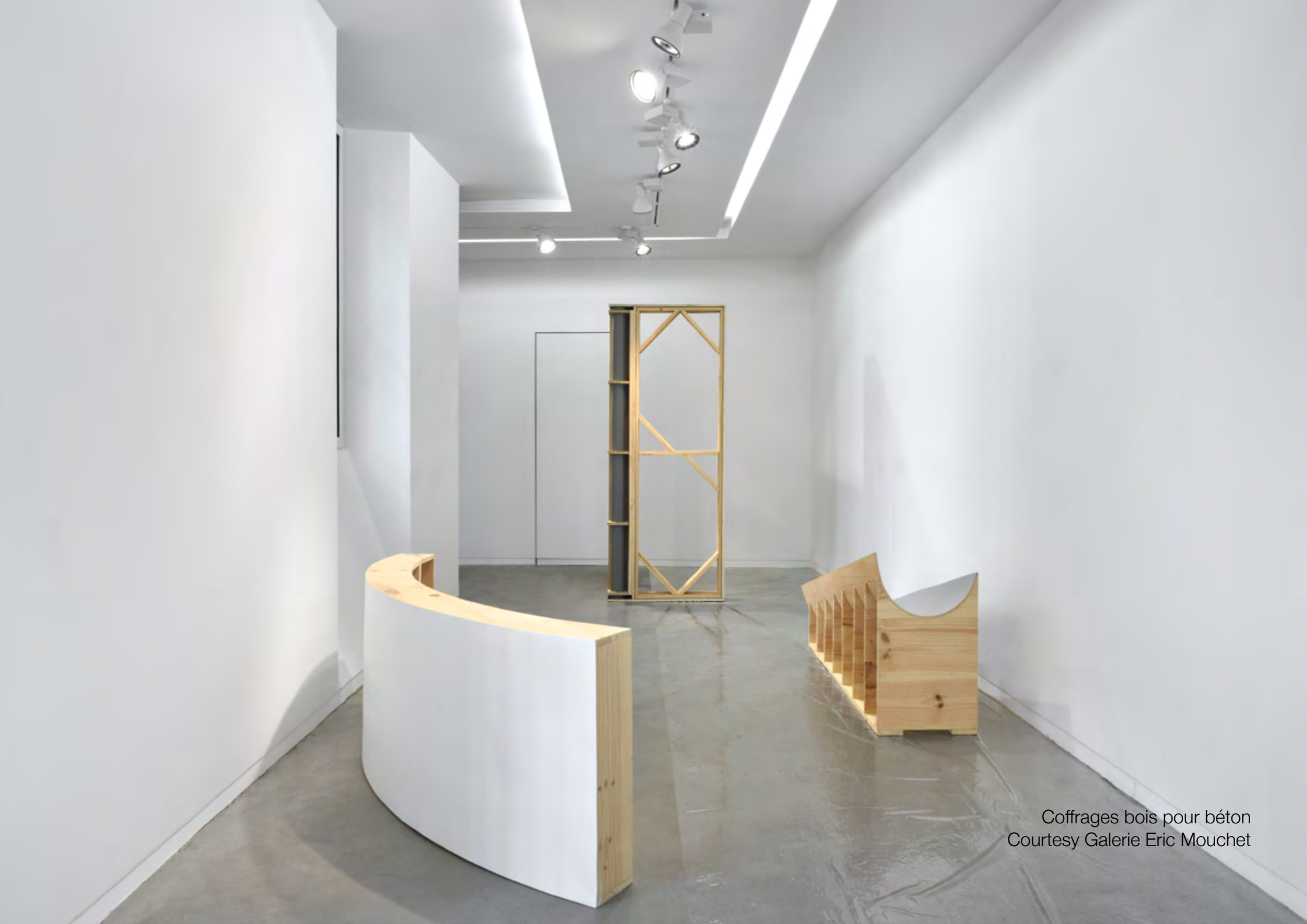
Coffrages bois pour béton