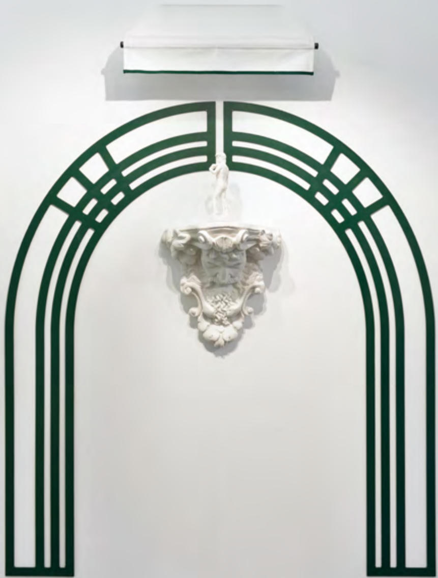
Mascaron au store banne, 2019, poudre de marbre, bois, métal, toile, 210x200x30 cm