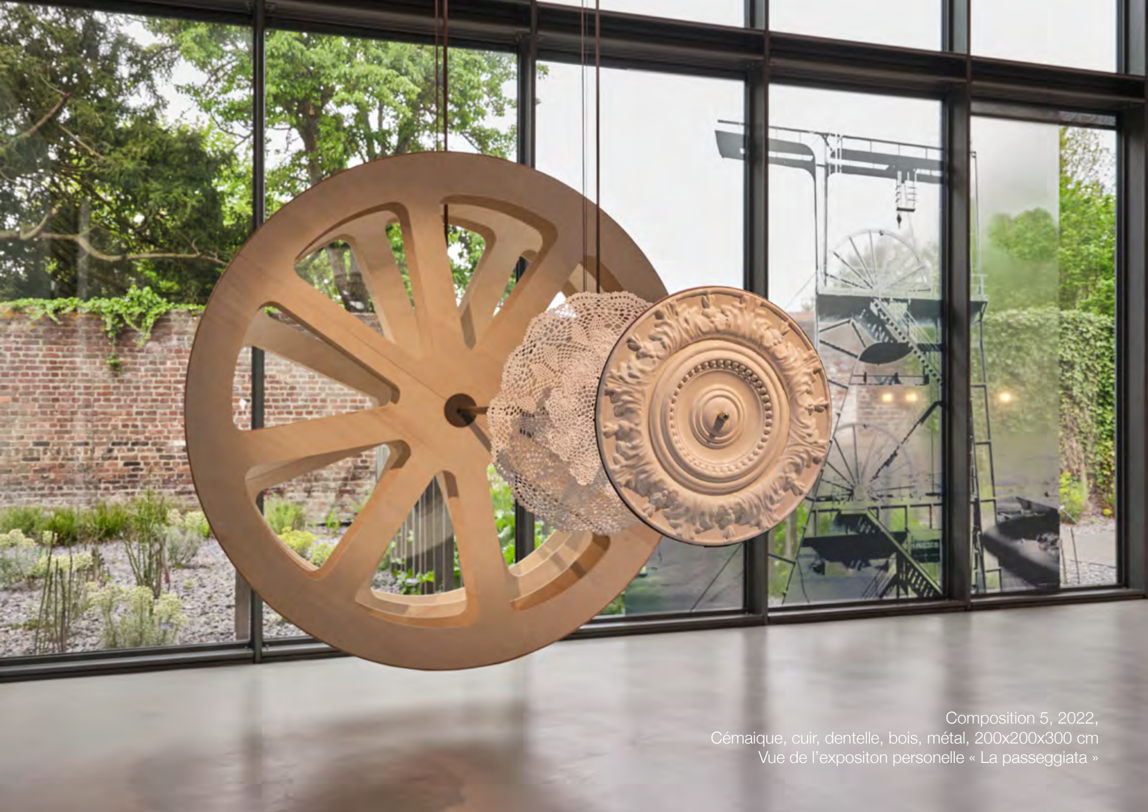
Composition 5, 2022, Céramique, cuir, dentelle, bois, métal, 200x200x300 cm Vue de l'expositon personelle « La passeggiata »