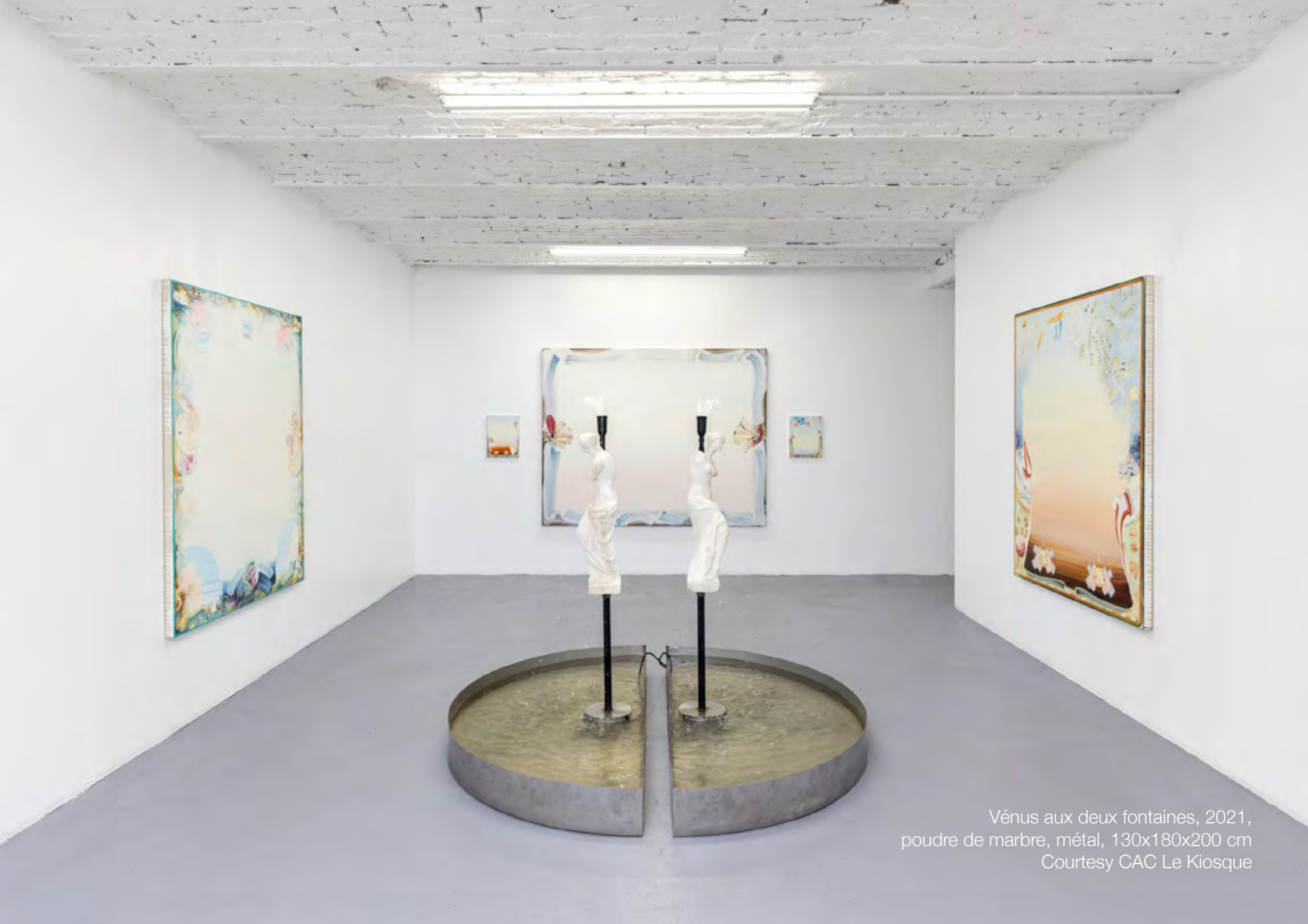
Vénus aux deux fontaines, 2021, poudre de marbre, métal, 130x180x200 cm