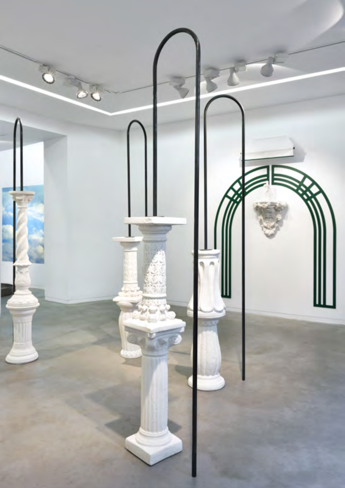
Assemblages en arche, 2019, poudre de marbre, métal, 200x300x300 cm