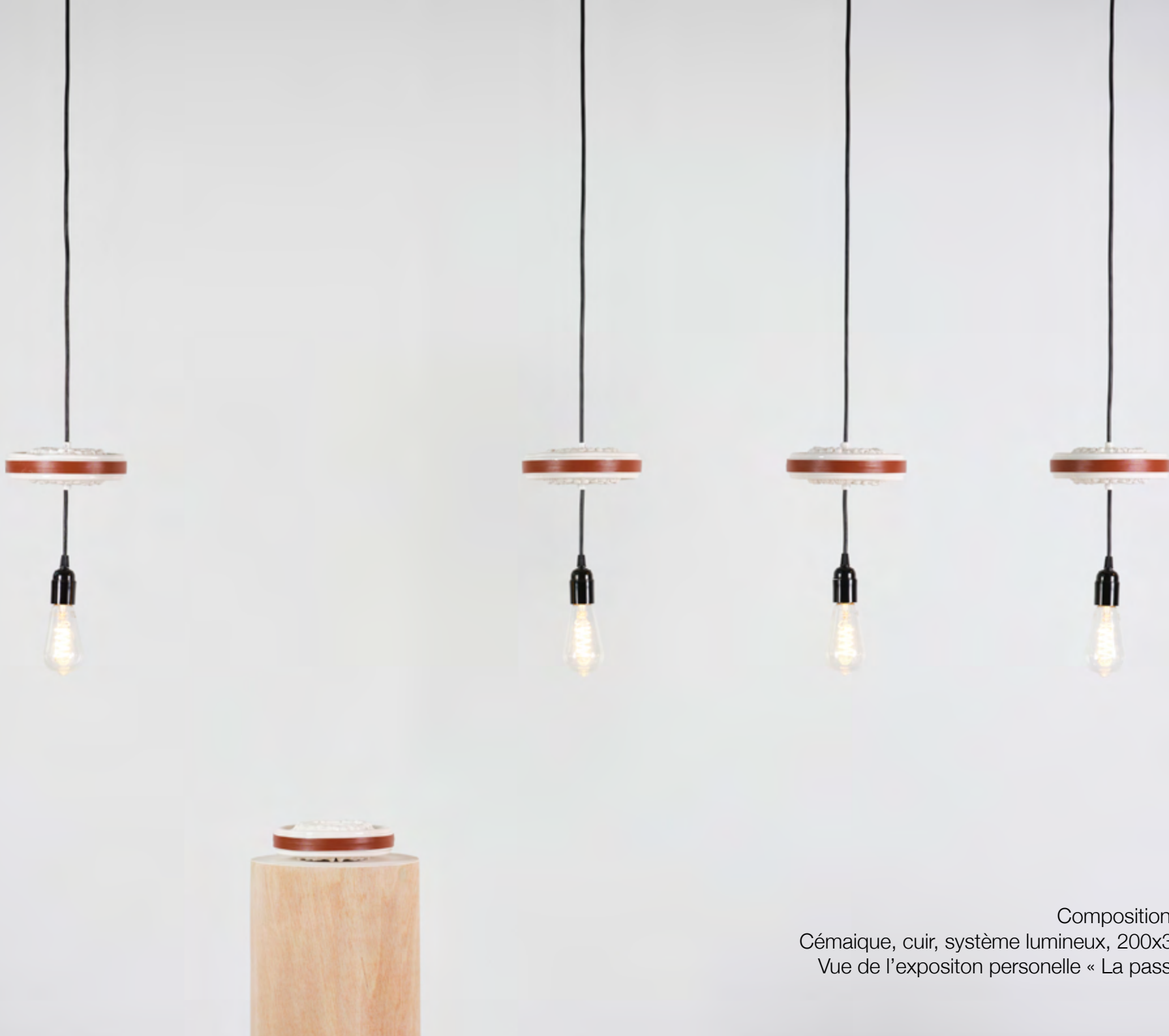
Composition 8, 2022, Céramique, cuir, système lumineux, 200x30x30 cm Vue de l'expositon personelle « La passeggiata »