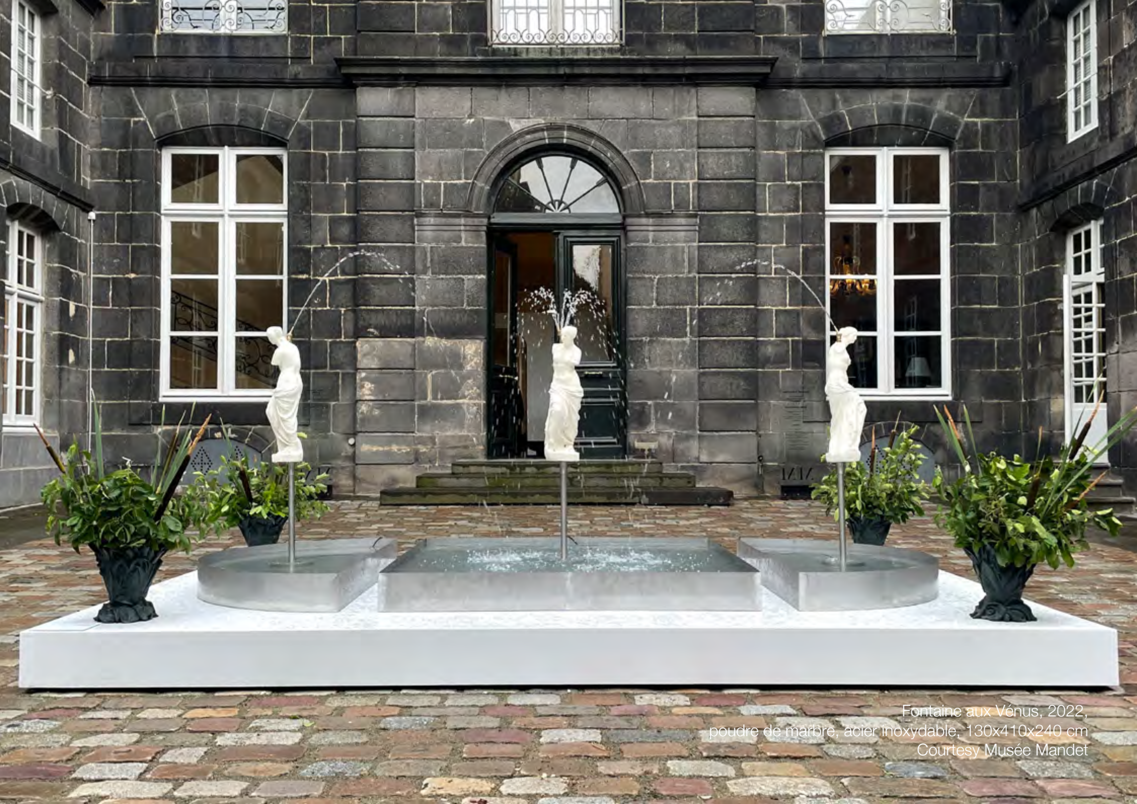
Fontaine aux Vénus, 2022, poudre de marbre, acier inoxydable, 130x410x240 cm