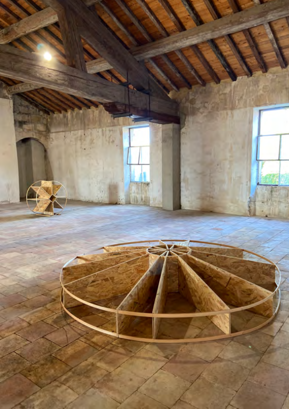
Meule dormante, 2020, bois, 240x240x40 cm En arrière-plan > Meule roulante, 2020, bois, 100x100x50 cm