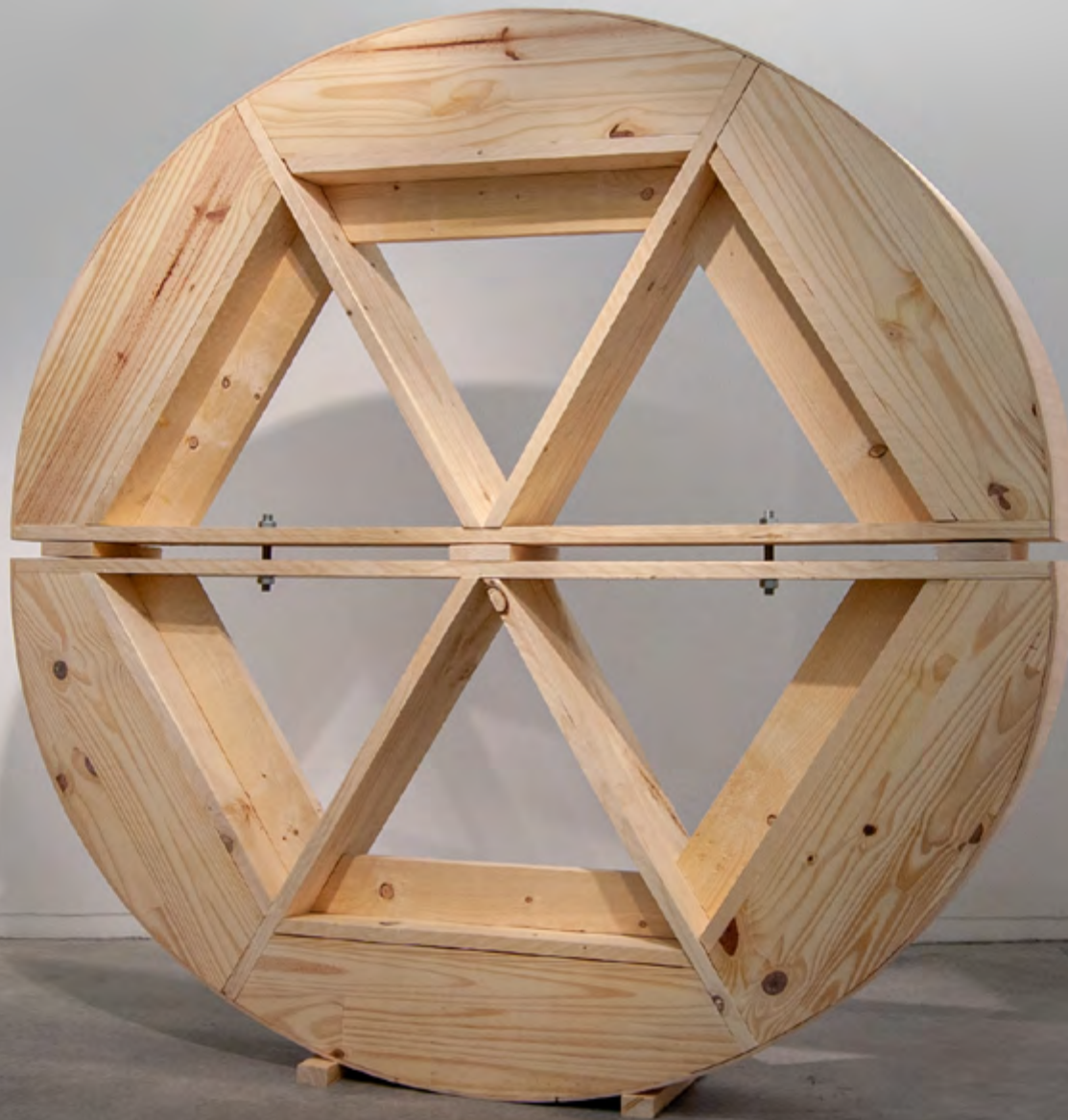
Coffrage pour œil-de-bœuf, 2015, bois, contreplaqué cintrable, 180x180x20 cm