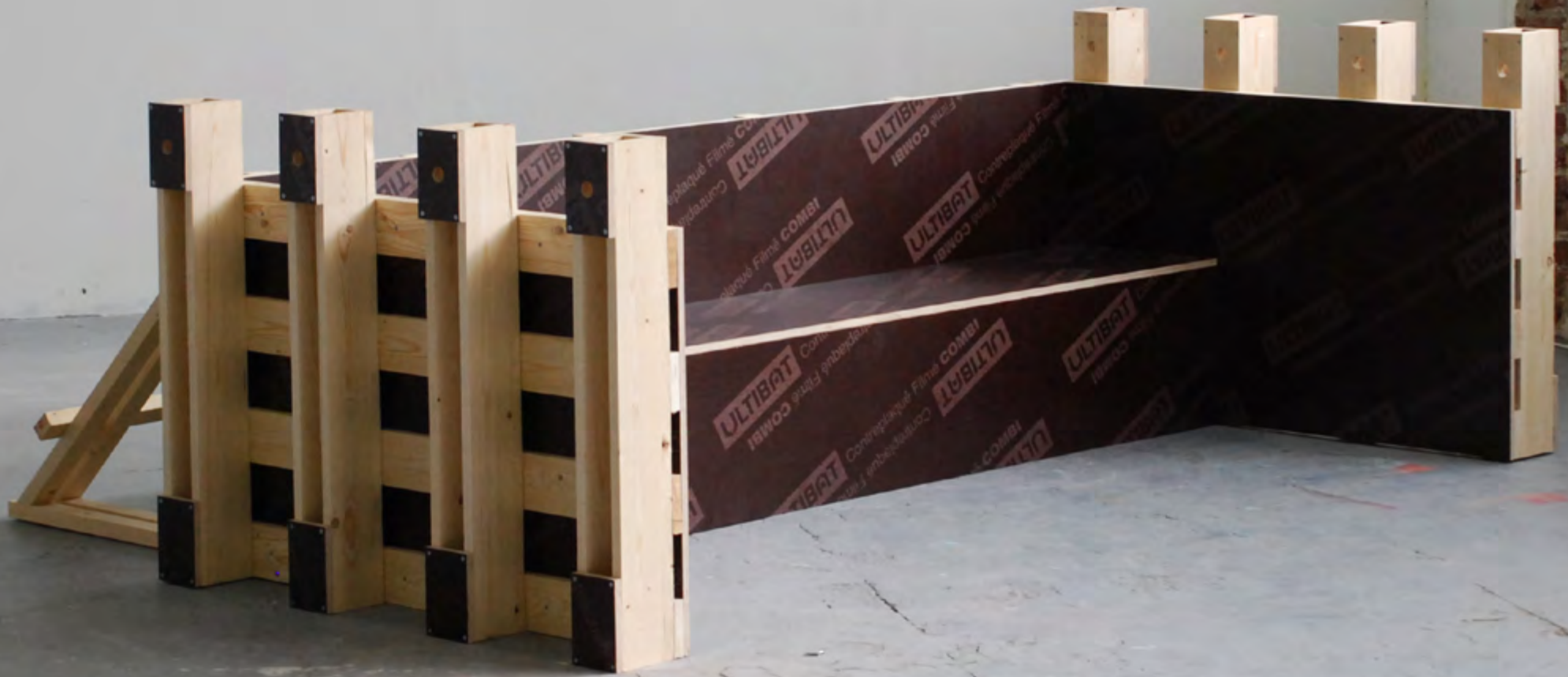
Coffrage pour quai de déchargement, 2015, bois, contreplaqué filmé, 90x250x220 cm