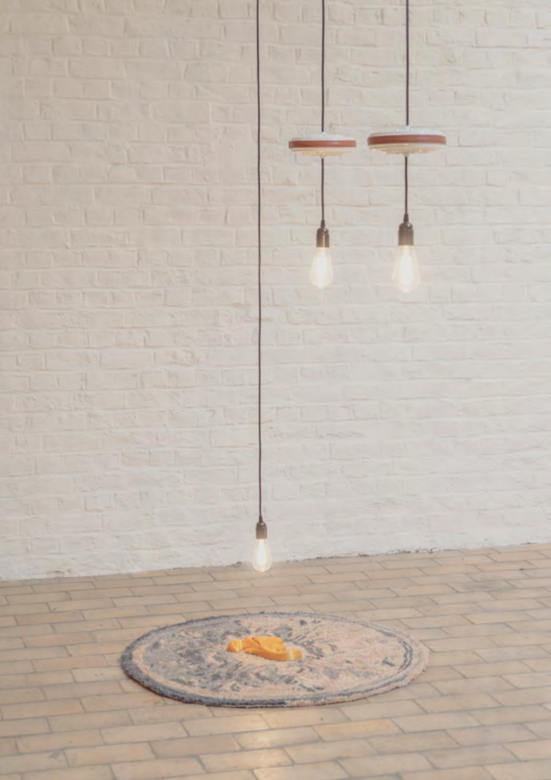
Composition 3, 2022, Cémaïque, tapis, impression 3D, 200x100x100 cm Vue de l'expositon personnelle « De l'aura »