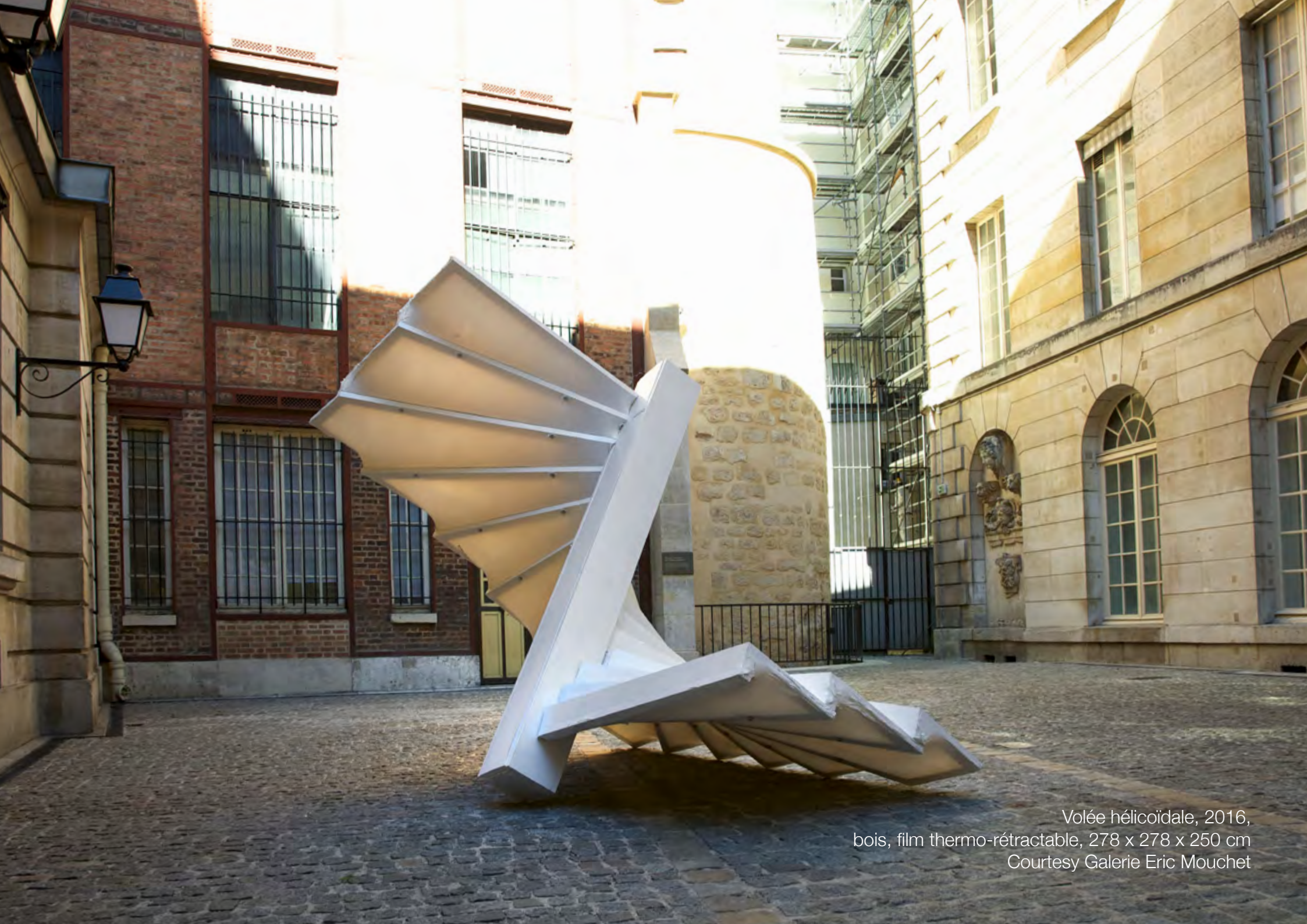
Volée hélicoïdale, 2016, bois, film thermo-rétractable, 278 x 278 x 250 cm