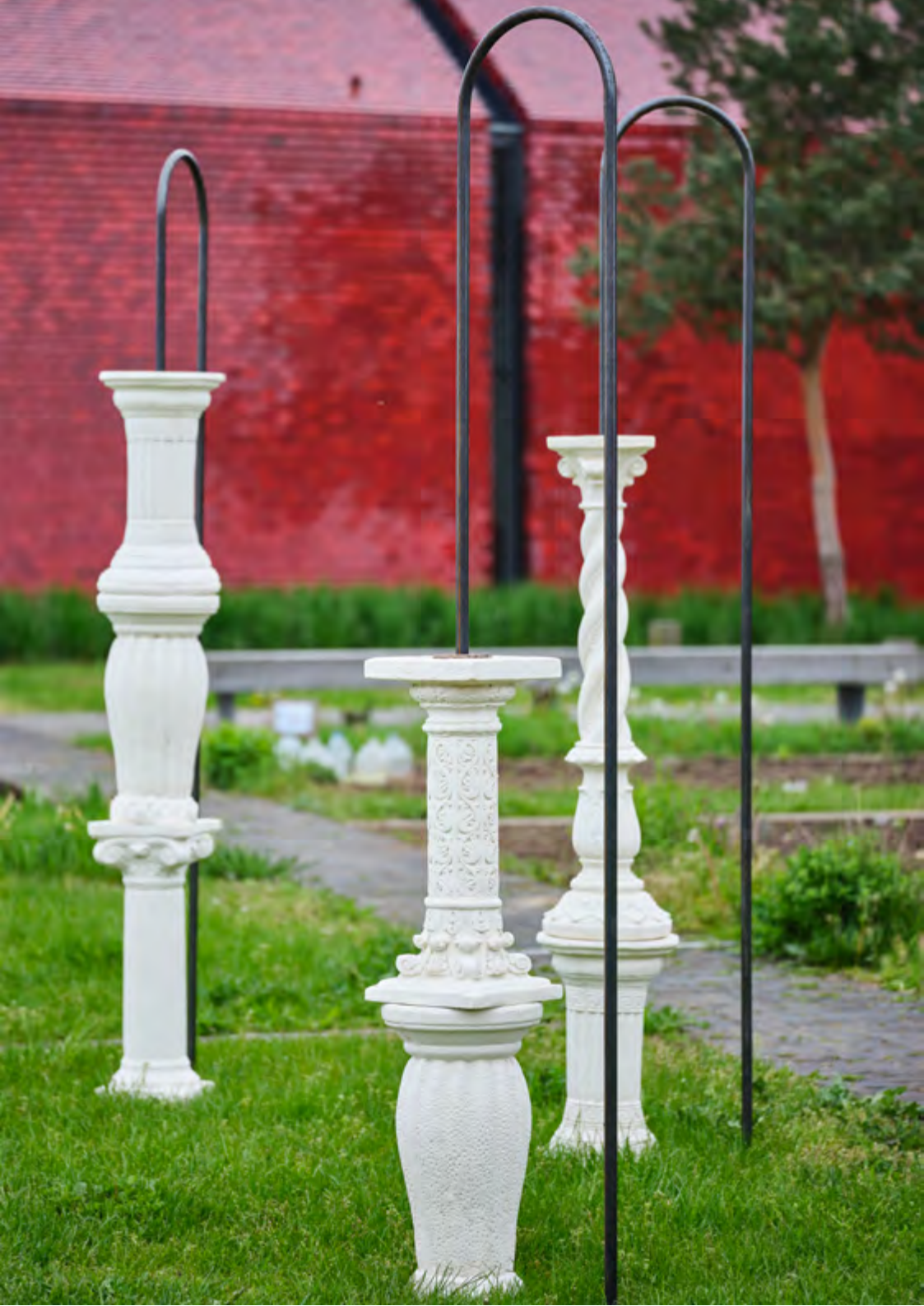
Assemblages en arche, 2019, poudre de marbre, métal, 200x300x300 cm Vue de l'exposition personnelle « La passeggiata »