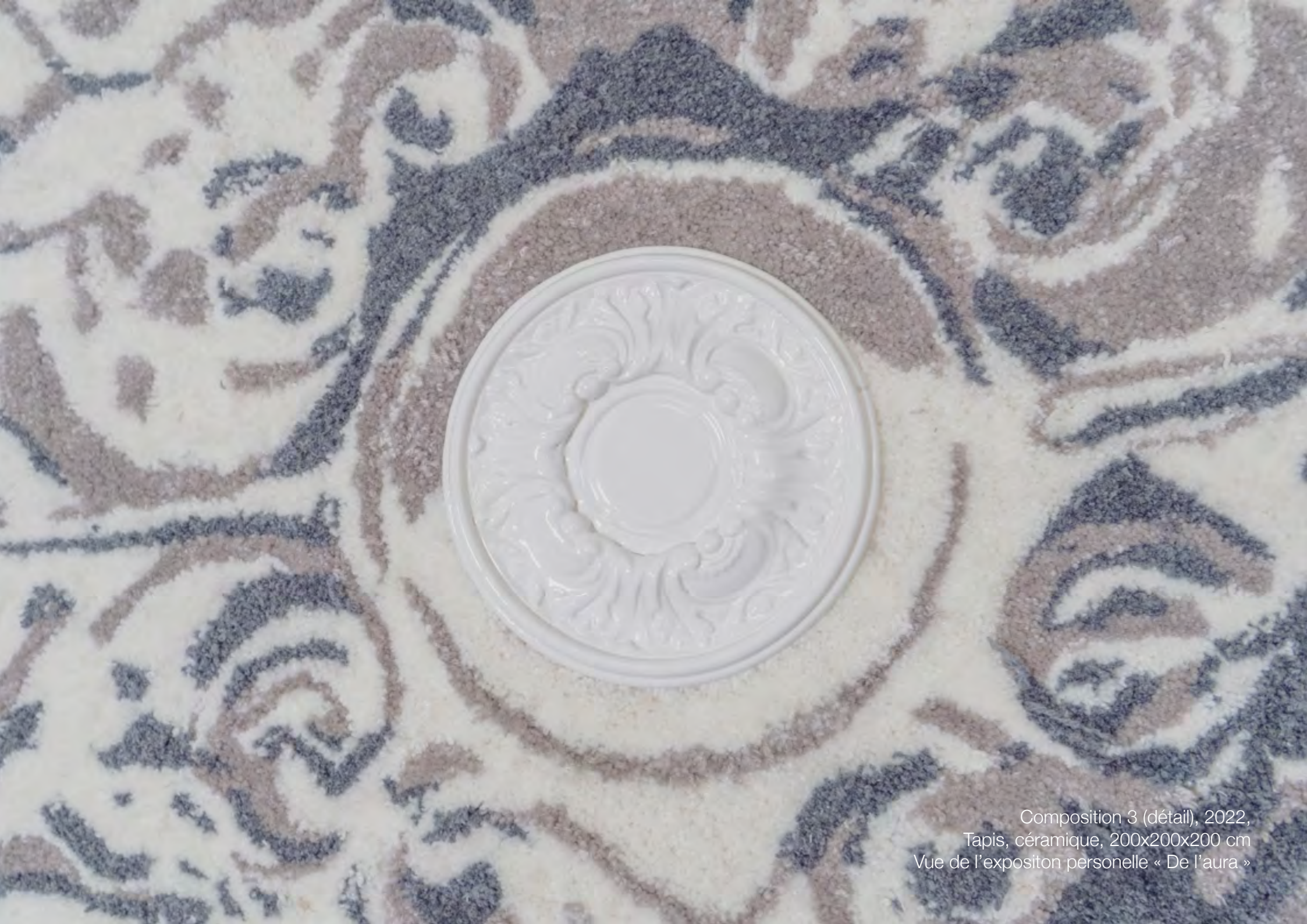
Composition 3 (détail), 2022, Tapis, céramique, 200x200x200 cm Vue de l'expositon personnelle « De l'aura »