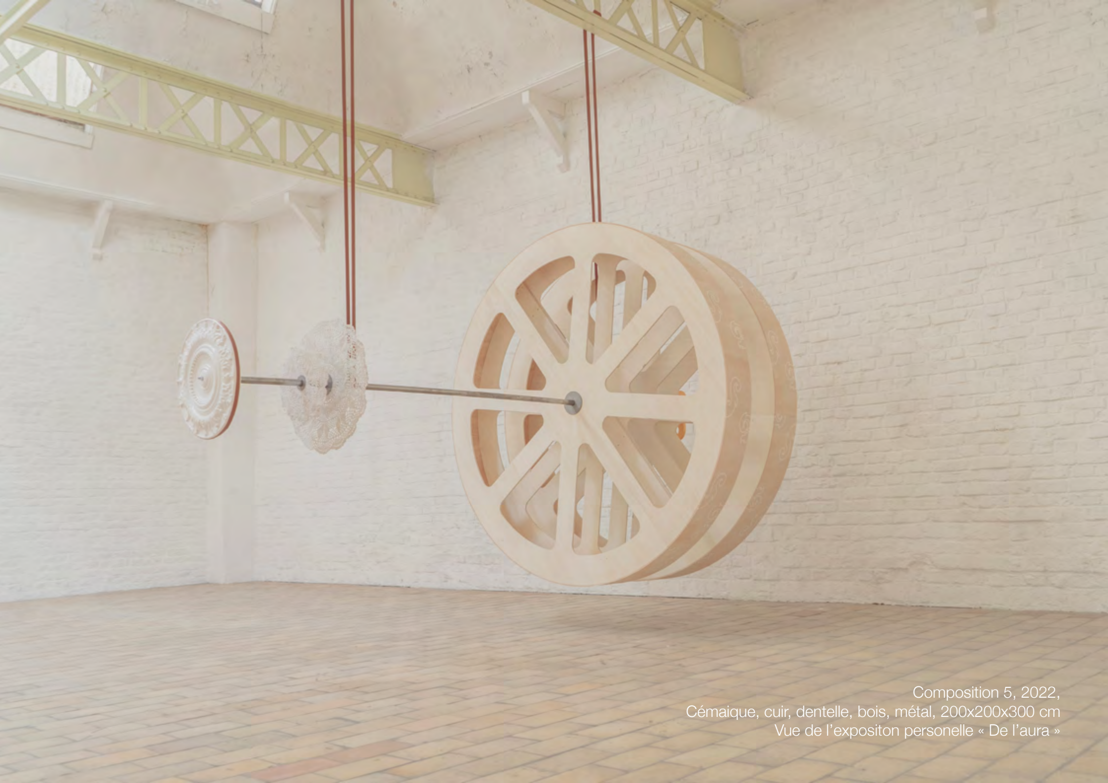
Composition 5, 2022, Céramique, cuir, dentelle, bois, métal, 200x200x300 cm Vue de l'expositon personnelle « De l'aura »