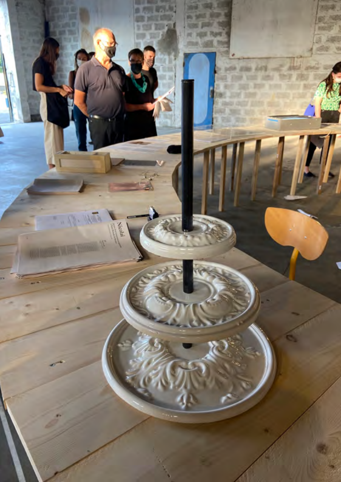
Rosaces en présentoir, 2020, faïence blanche émaillée, acier, 60x40x40 cm