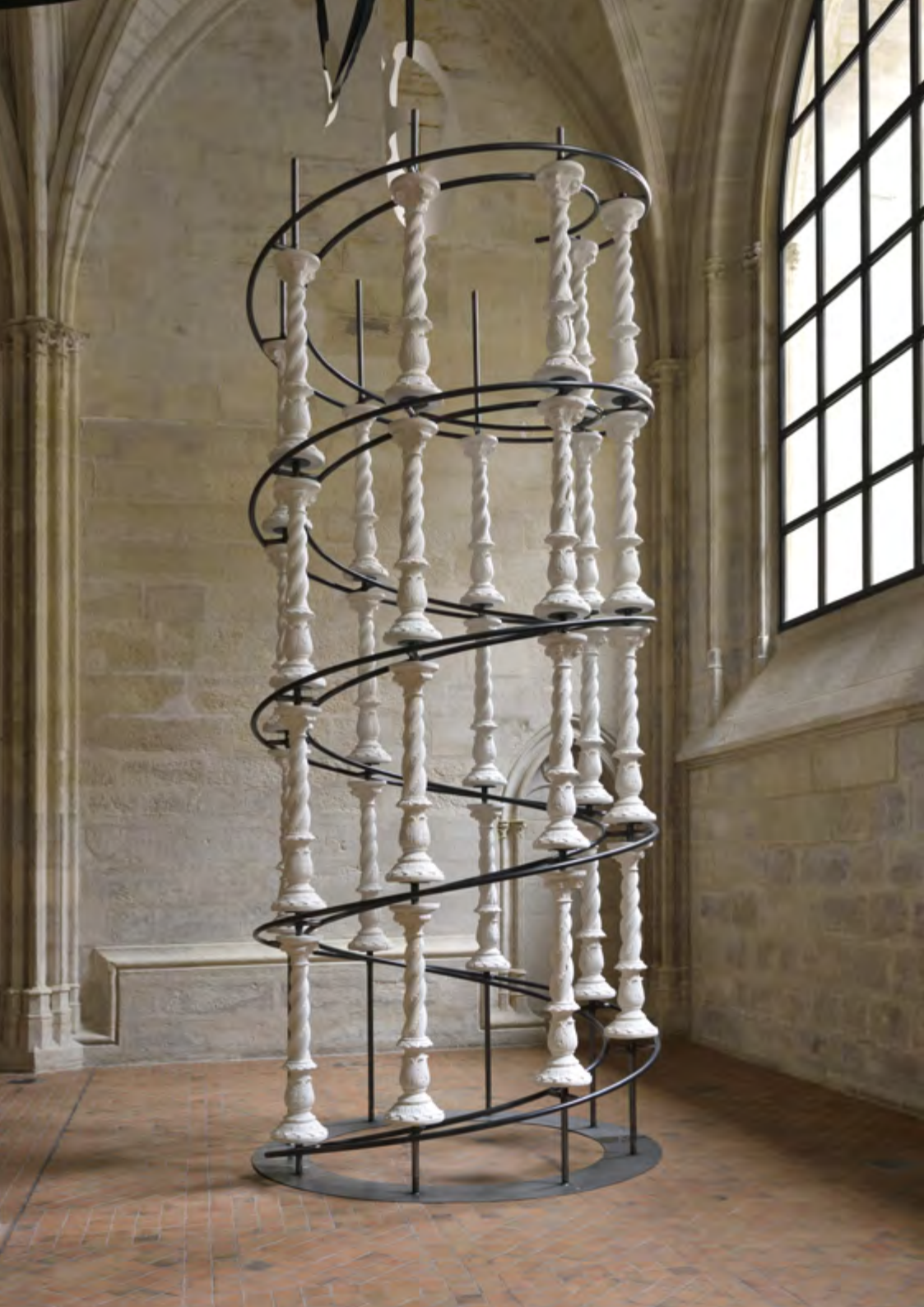
Colonnes à la torsade, 2019, acier, plâtre et poudre de marbre, 500x200x200 cm