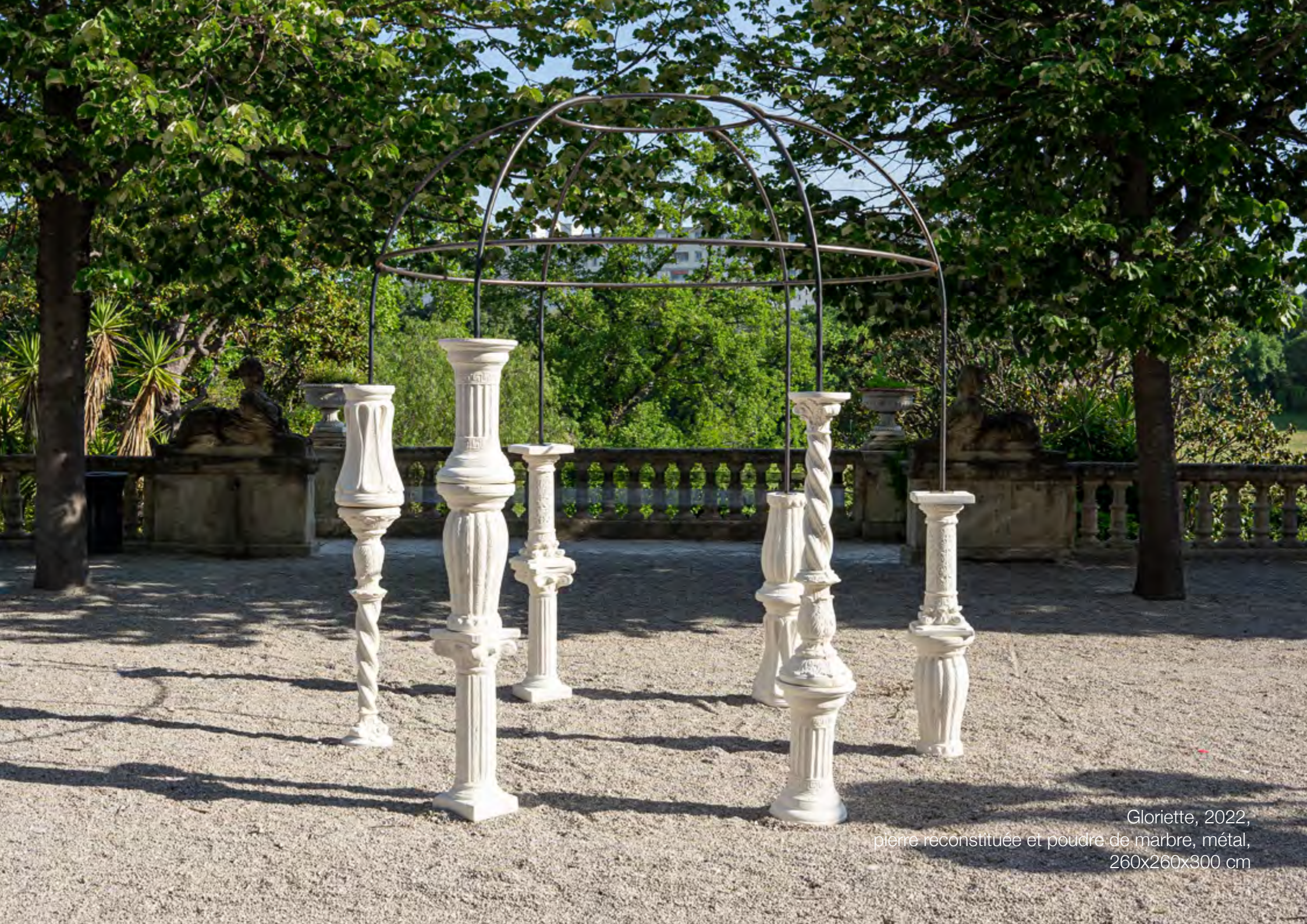
Gloriette, 2022, pierre reconstituée et poudre de marbre, métal, 260x260x300 cm