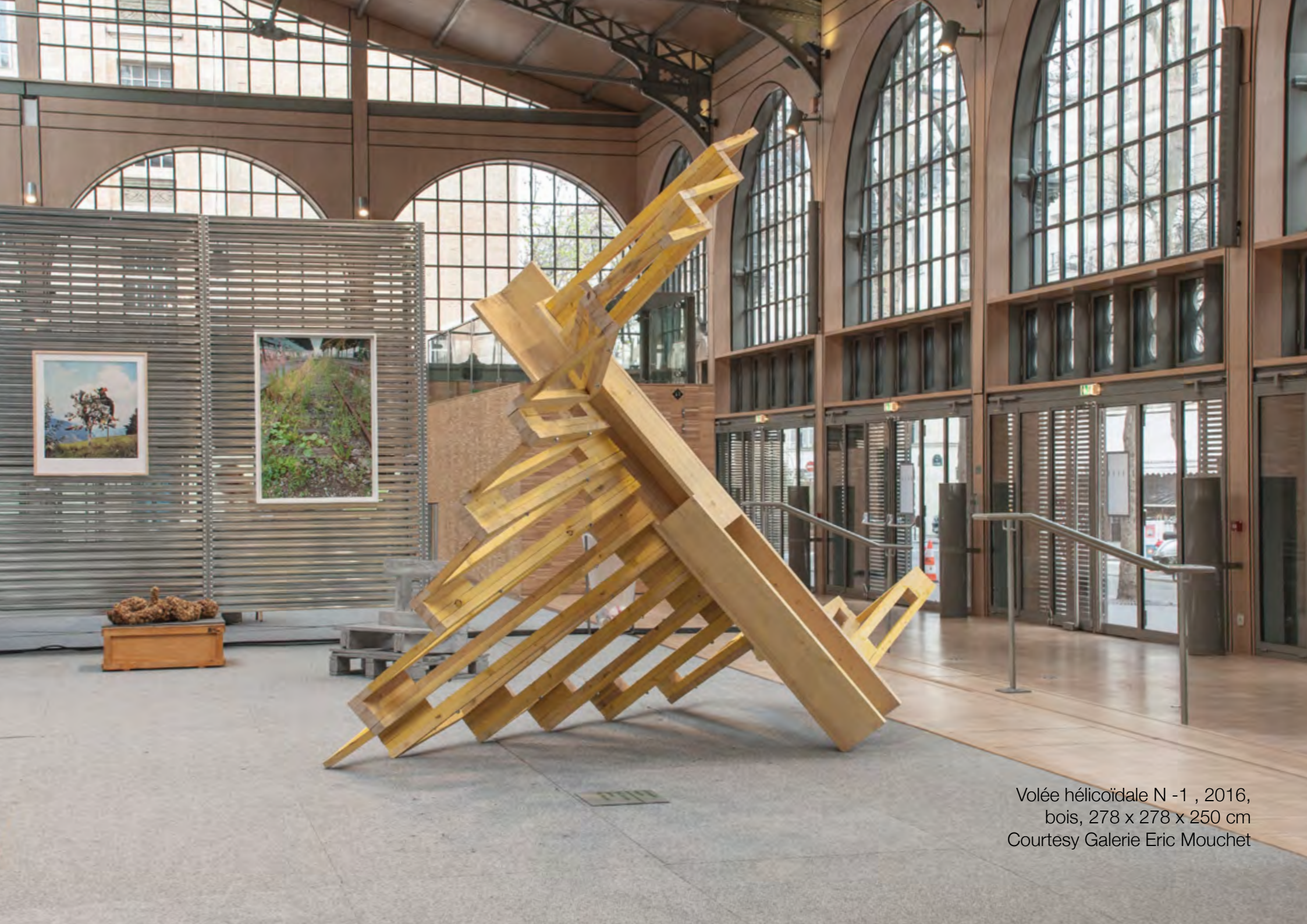
Volée hélicoïdale N -1 , 2016, bois, 278 x 278 x 250 cm