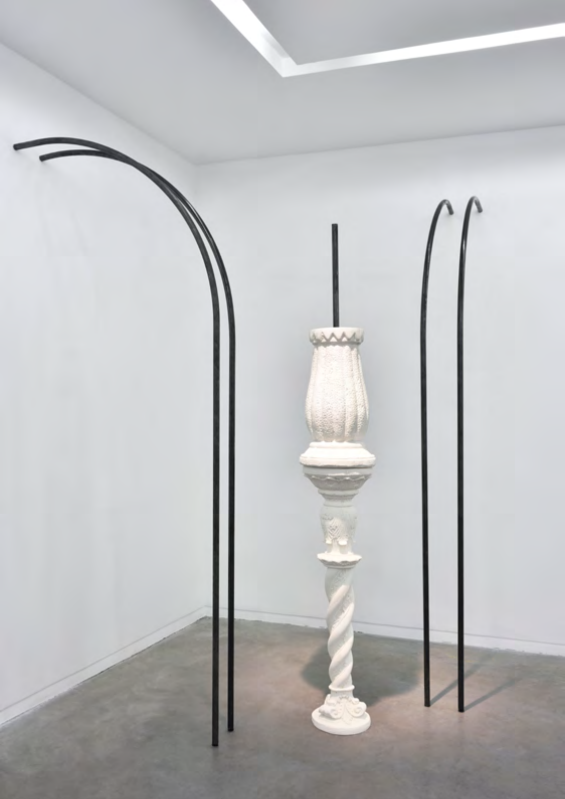
Assemblage aux deux arches, 2019 poudre de marbre, métal, 220x150x150 cm