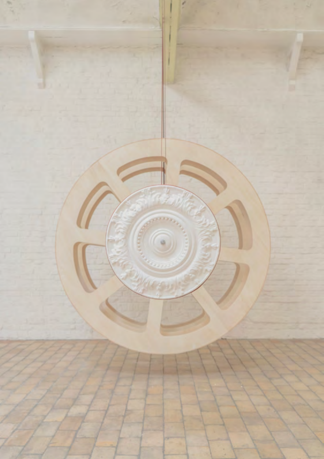
Composition 5, 2022, Céramique, cuir, dentelle, bois, métal, 200x200x300 cm Vue de l'exposition personnelle « De l'aura »