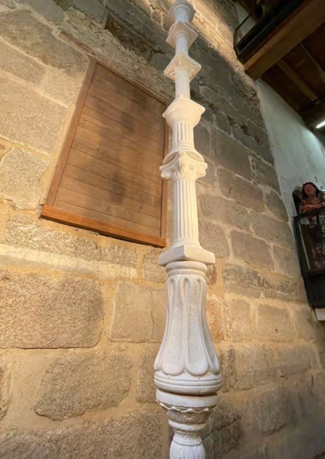
Colonne sans fin, 2022 poudre de marbre, métal, 700x30x30 cm