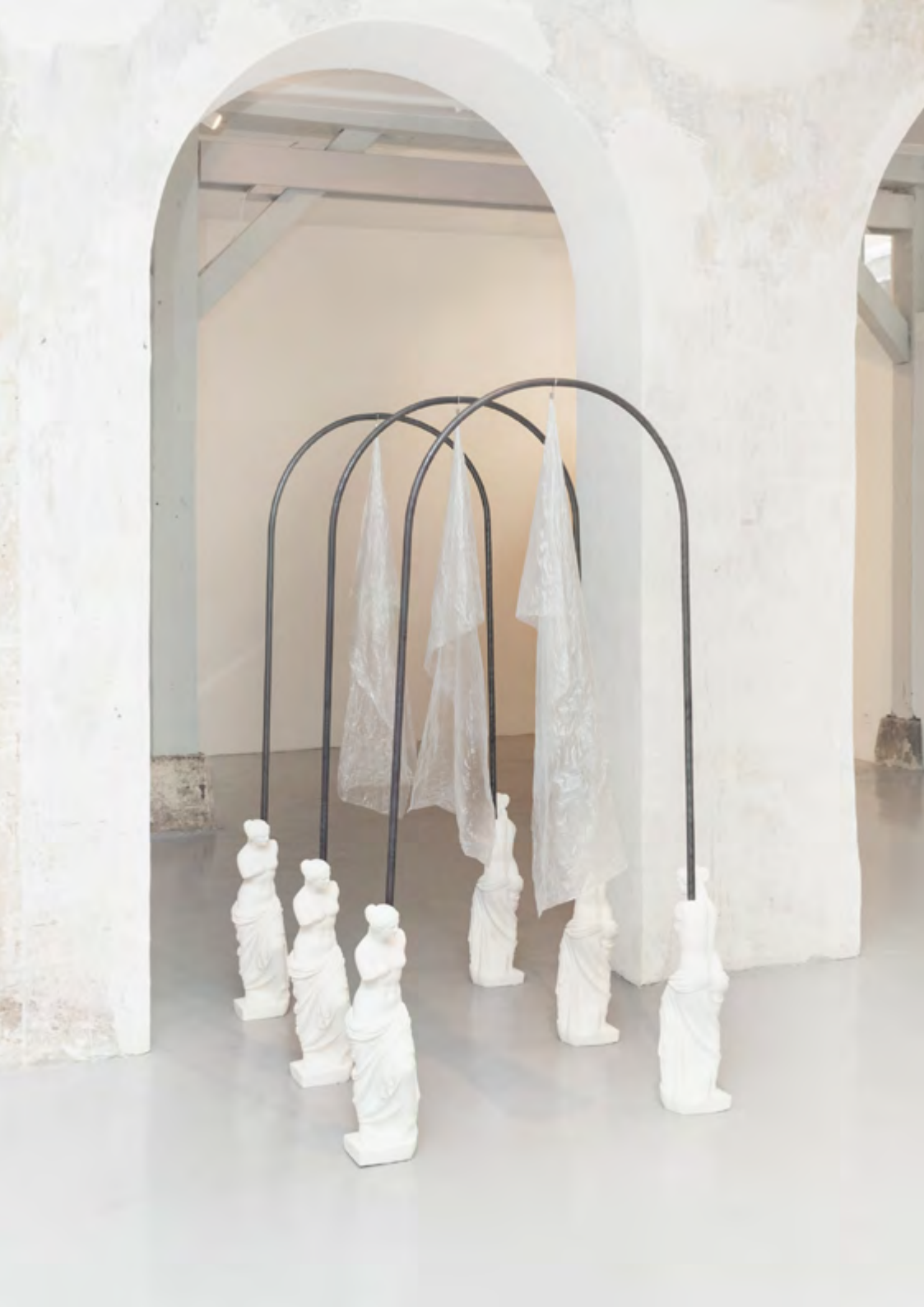
Vénus à l'arche, 2019, poudre de marbre, métal, 200x100x150 cm