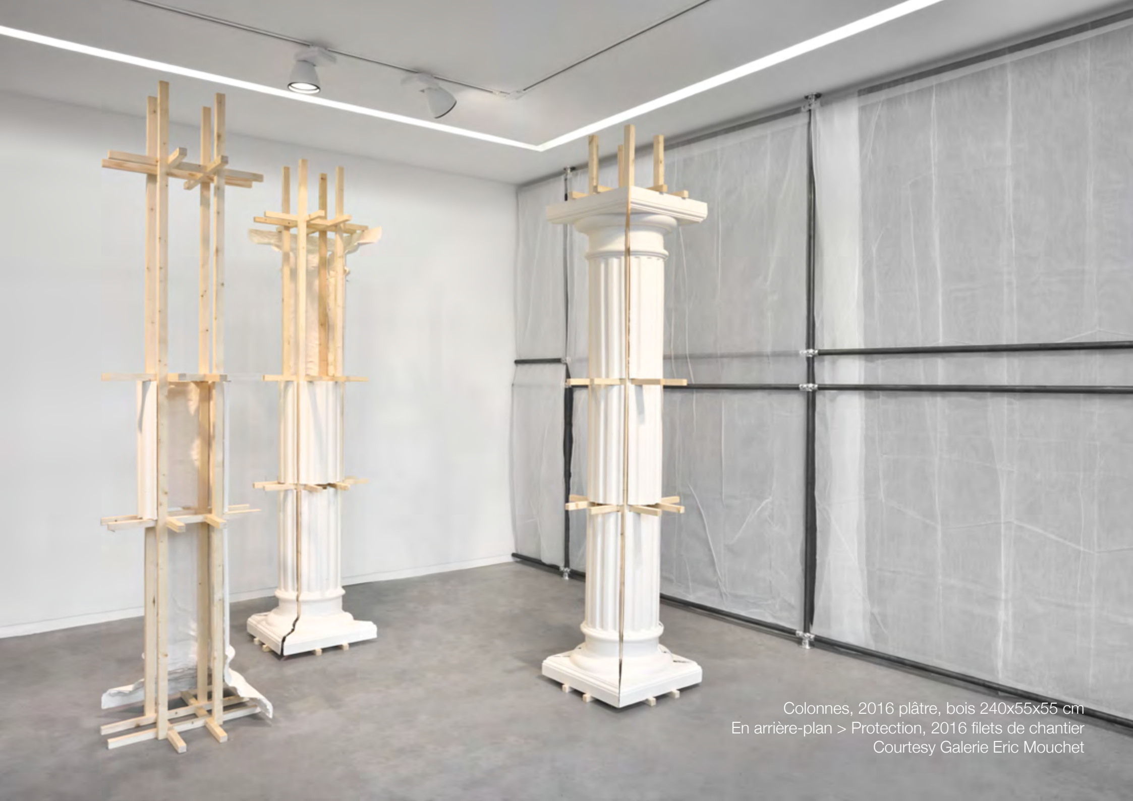
Colonnes, 2016 plâtre, bois 240x55x55 cm En arrière-plan > Protection, 2016 filets de chantier