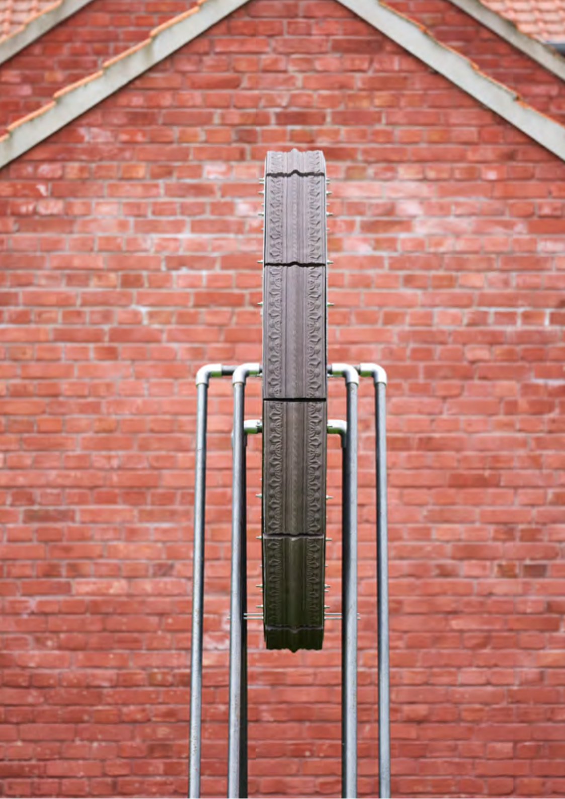
Grande roue aux modules, 2023, Grès estampé, acier, découpe laser, 250x150x50 cm Vue de l'exposition personnelle « La passeggiata »