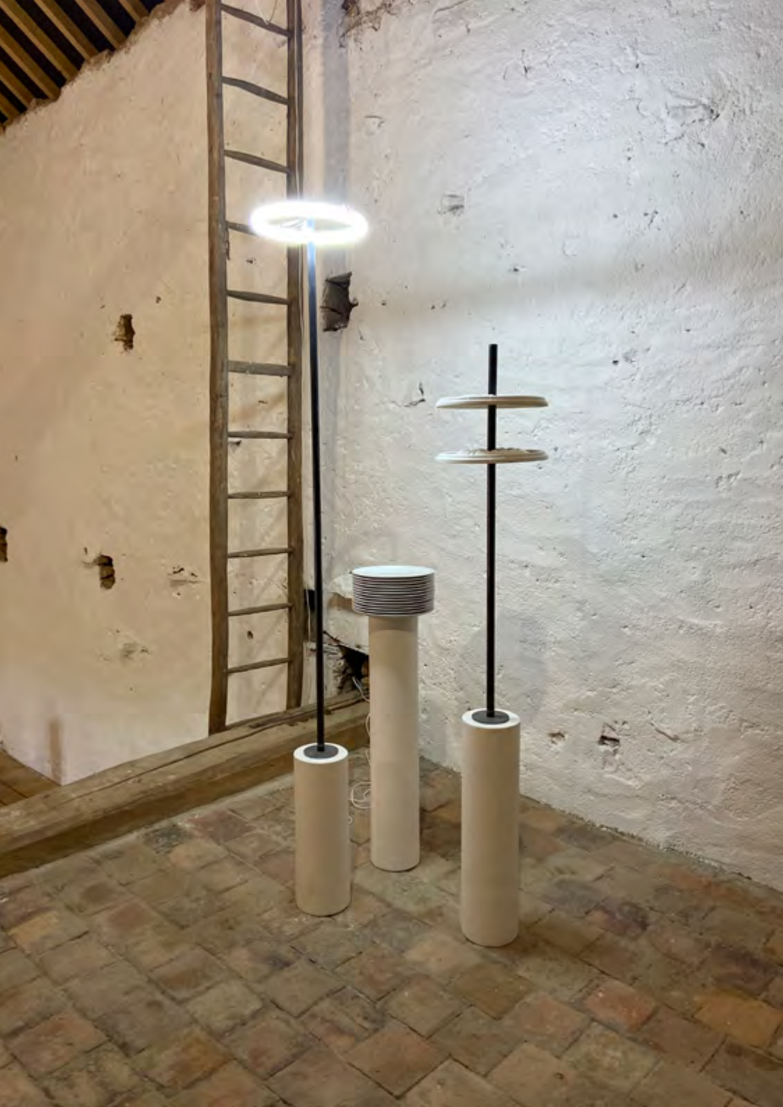
Variation, 2020, métal, plâtre, néon, céramique, assiettes IKEA