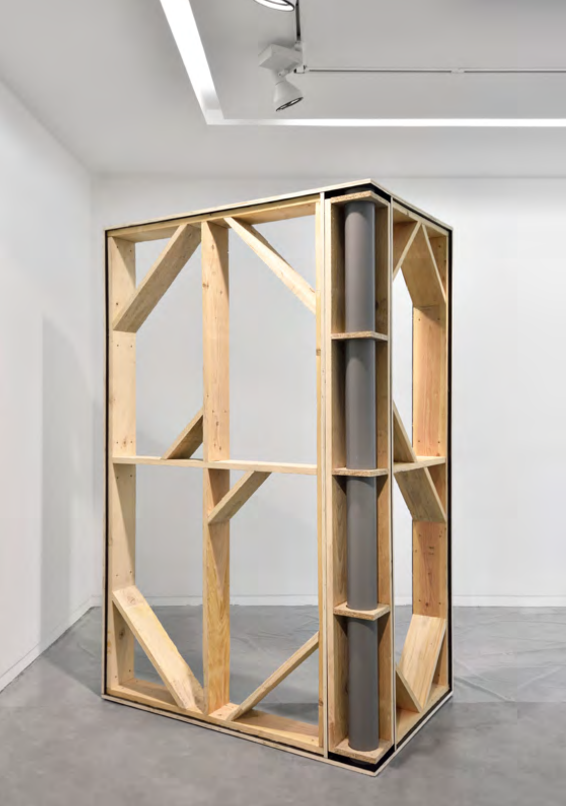
Mannequin de fenêtre, 2016, bois, tube PVC, 193x120x80 cm