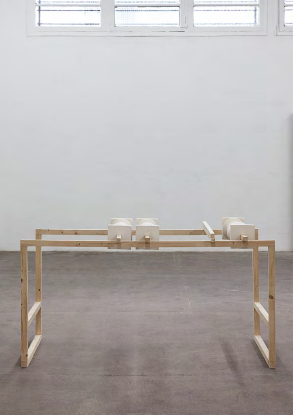
Présentoir, 2016, bois, plâtre. 160x80x80 cm