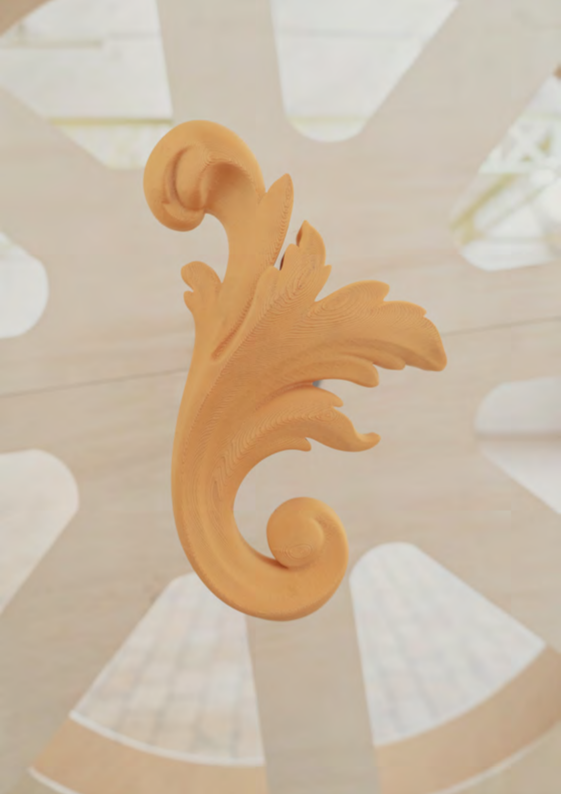
Composition 5 (détail), 2022, Bois, impression 3D, 200x200x300 cm Vue de l'expositon personnelle « De l'aura »