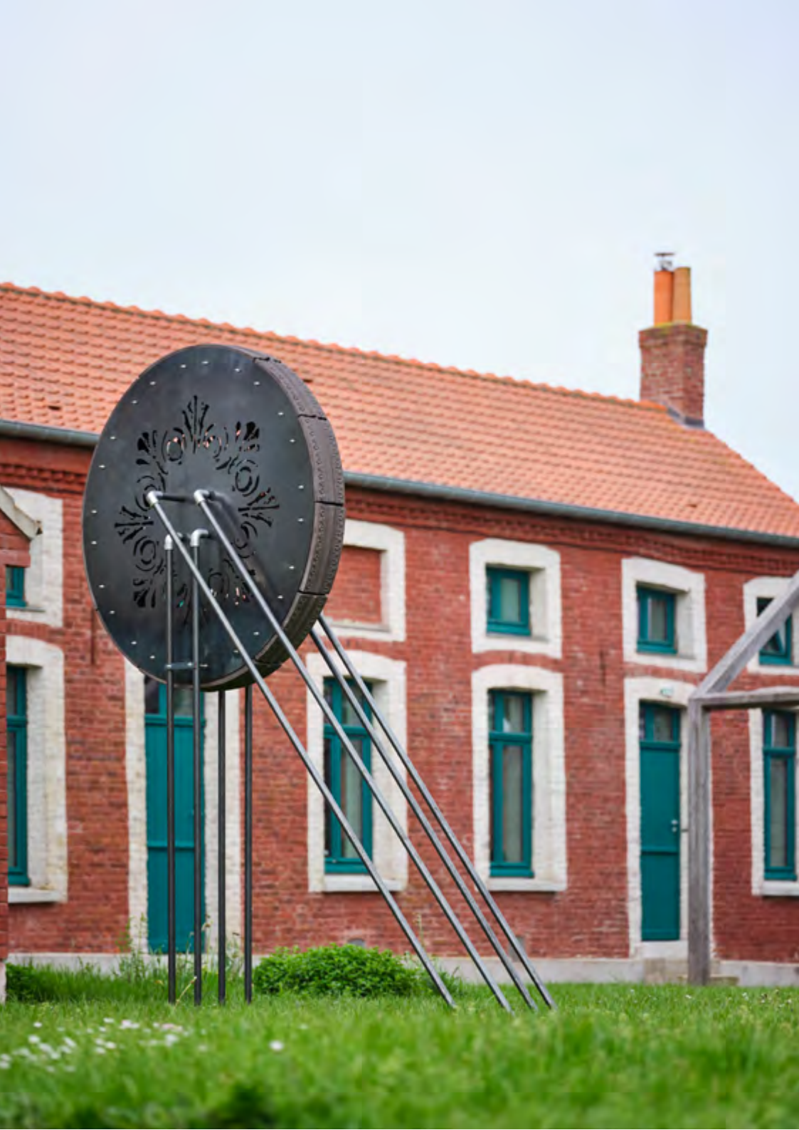
Grande roue aux modules, 2023, Grès estampé, acier, découpe laser, 250x150x50 cm Vue de l'exposition personnelle « La passeggiata »