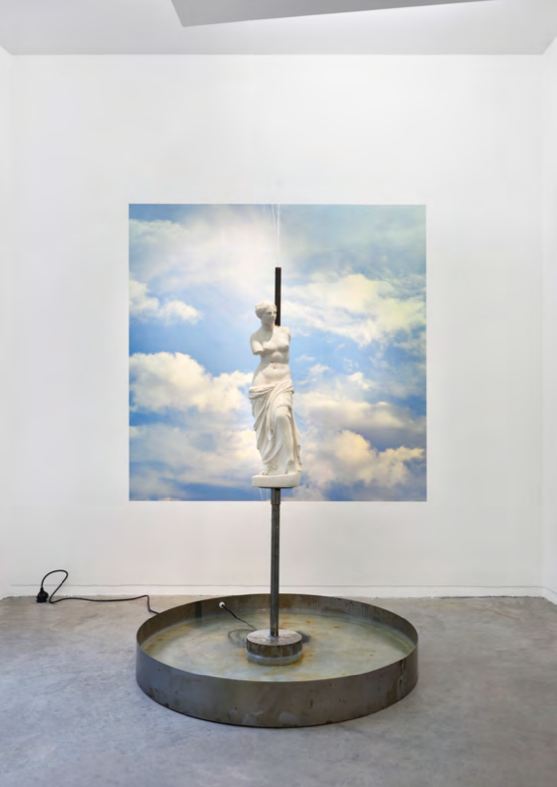
Vénus à la fontaine, 2019, poudre de marbre, métal, 200x100x100 cm