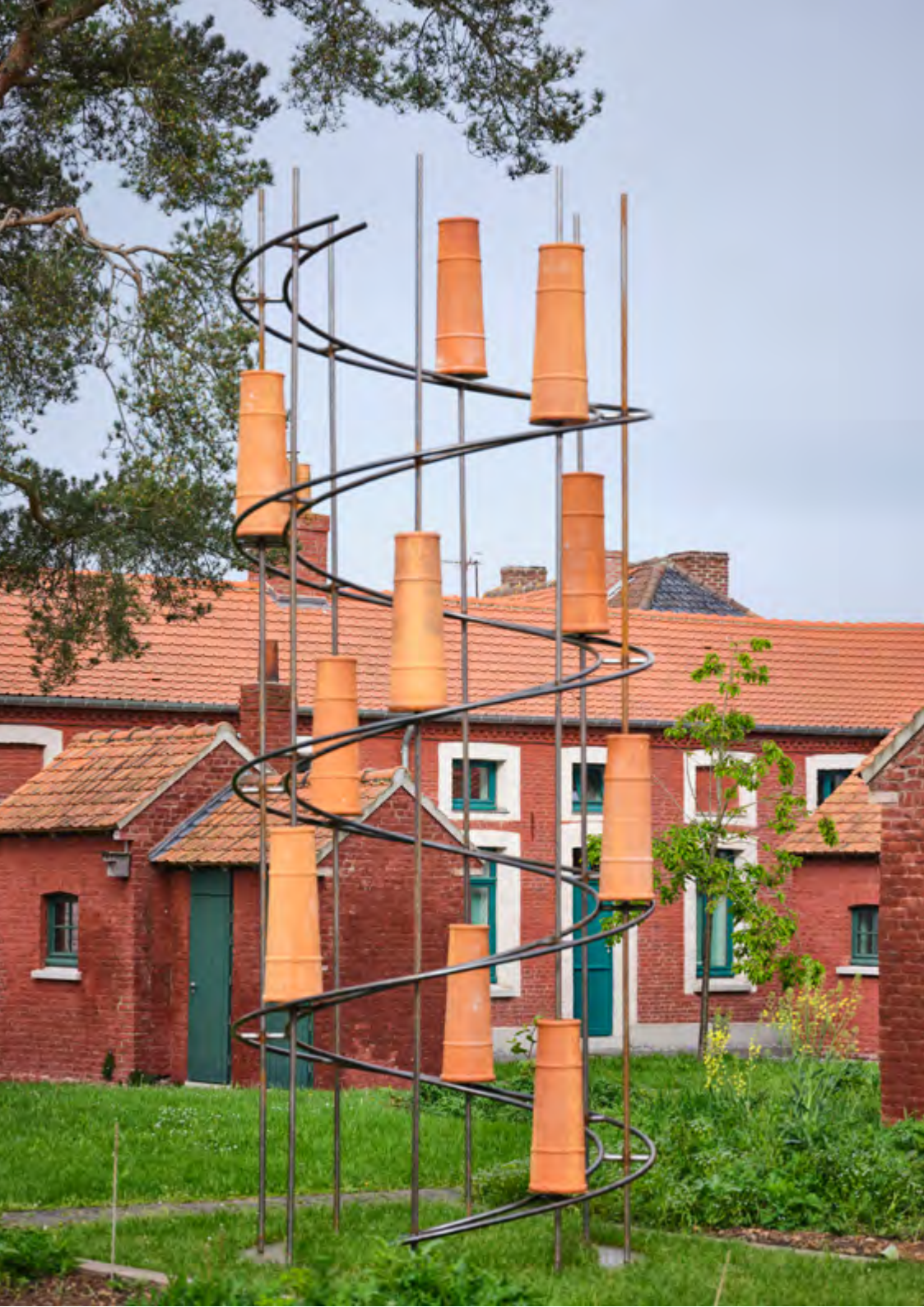
Torsade aux pots de cheminées, 2023, Acier cintré, pots de cheminées, 500x200x200 cm Vue de l'exposition personnelle « La passeggiata »