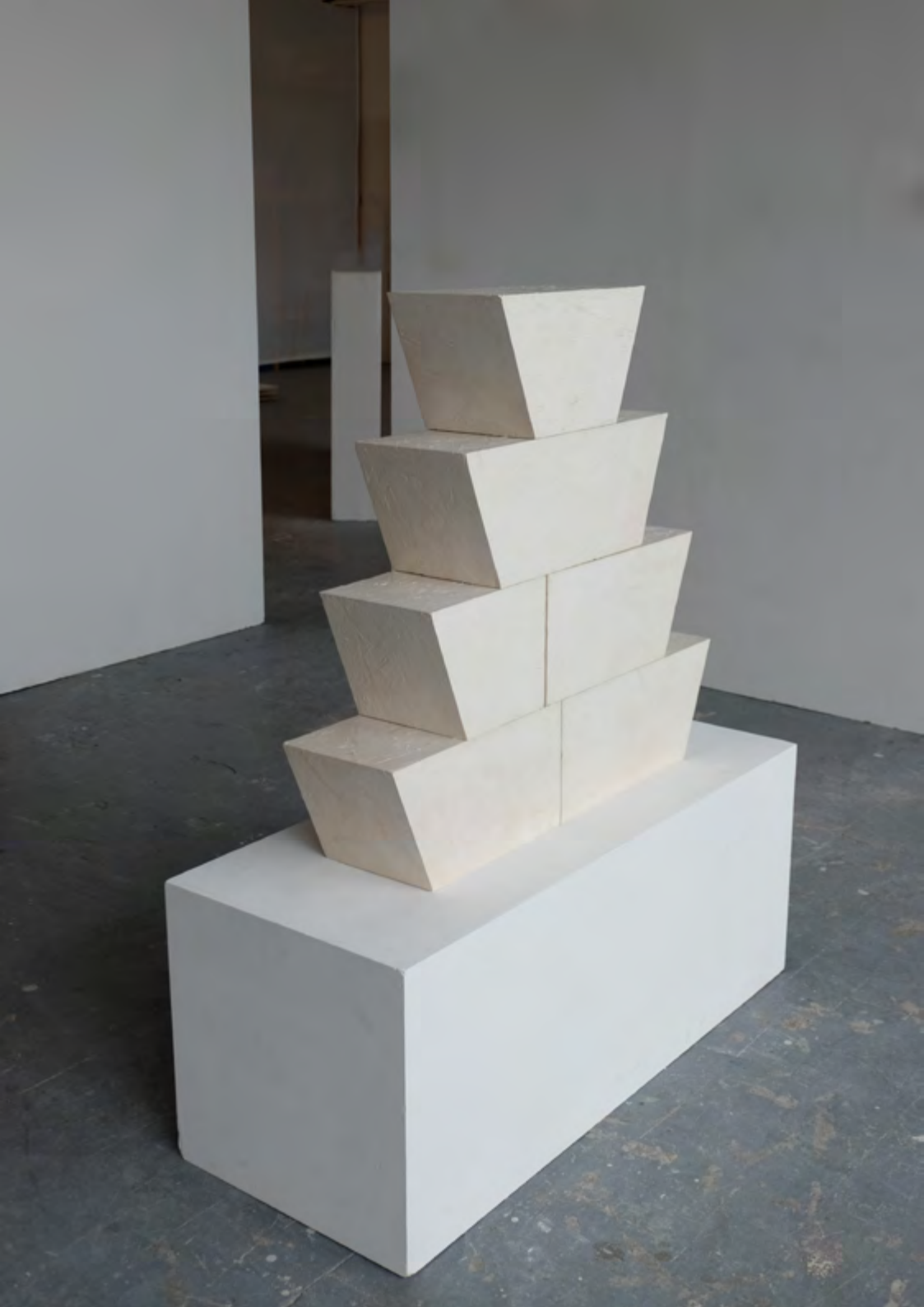
Reproduction (Jericho), 2018, marbre composite, 50x60x18 cm